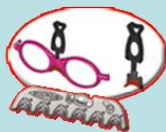
Placa de 6 formas de nariz